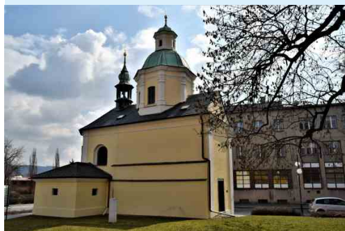
Kaple sv. Josefa v Lipníku nad Bečvou