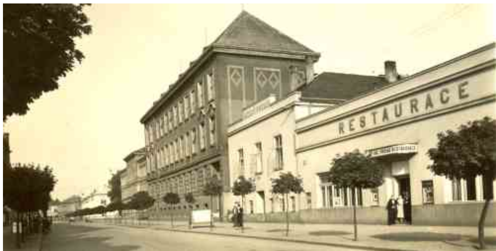
Restaurace Akciového pivovaru v Komenského třídě na snímku ze 30. let dodnes po více než 140 letech slouží pohostinství.

Na snímku z 60. let je budova někdejšího hostince U Mazáčů na rohu Kojetínské a Husovy ulice (na snímku vpravo). Jak je patrné ze snímku, dům musel být v následujících letech z důvodu větší frekvence provozu odstraněn.