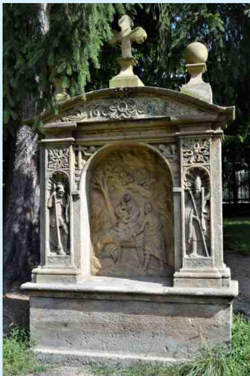
Útěk do Egypta - reliéf výklenkové kapličky v Klášterci nad Ohří

František a celý loňský rok zasvětil sv. Josefovi. Patronát drží také nad celou řadou řemesel i skupin lidí v nelehkých situacích. Patří zde například dřevorubci, tesaři, truhláři, řezbáři, bednáři, bečváři, koláři, dělníci, inženýři, hrobníci, vychovatelé, cestující, vyhnanci, uprchlíci a bezdomovci.