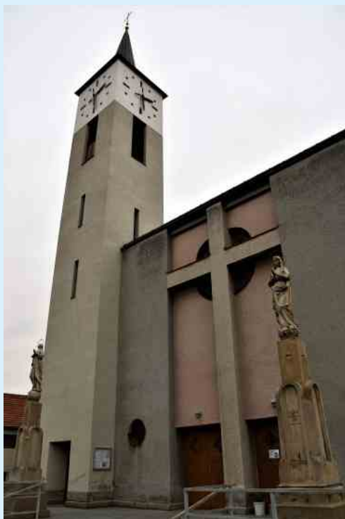
Kostel sv. Josefa v Radslavicích