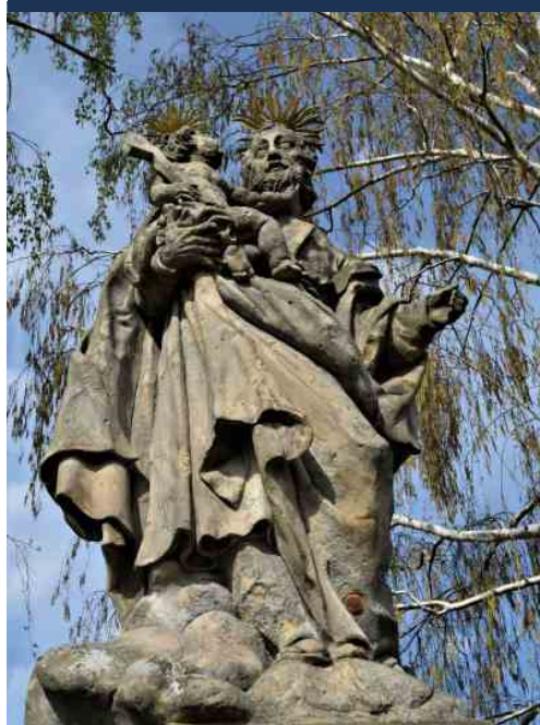
Dub nad Moravou