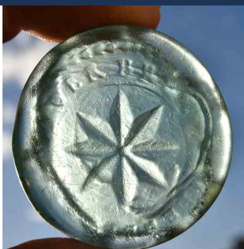
Kruhová skleněná pečeť s erbovním znamením v podobě osmicípé hvězdy

S ohledem na současné nepříznivé klimatické podmínky, především množství a intenzitu sněhových srážek, bylo nezbytné dočasně výzkumné práce přerušit a odkryté archeologické situace zabez-