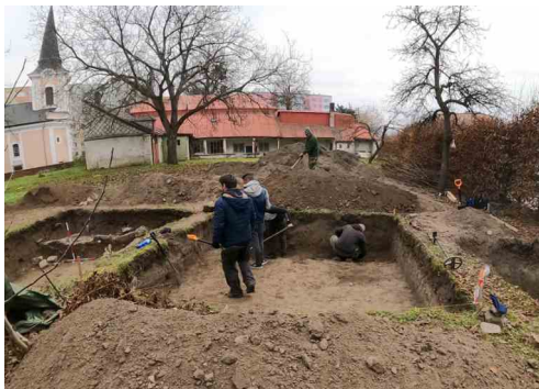
Celkový pohled na plochu výzkumu v roce 2021. V pozadí kostel sv. Máří Magdaleny a objekt staré fary.

V roce 2021 byly přerovskými archeology položeny tři archeologické sondy v ploše, která bude bezprostředně dotčena výstavbou nového objektu Charity.