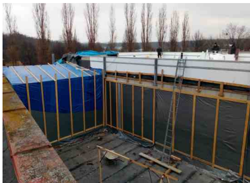
Dokončování pláště nové budovy. Zatímco na staré budově už probíhá příprava na stěhování knihovny. Listopad 2021.