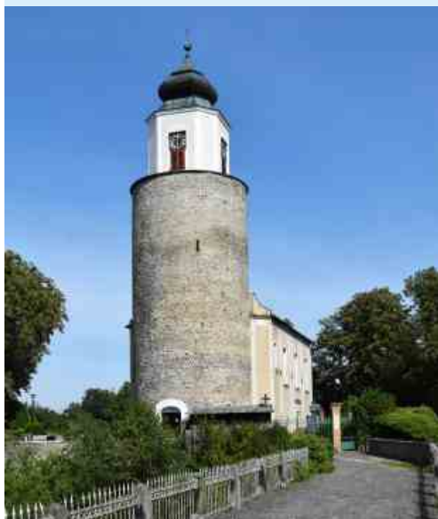
Kostel sv. Josefa v Žulové

Při svých toulkách po českých hradech a zámcích jsem navštívil také část interiéru zámku Žampach nedaleko Letohradu (dnes domov pro osoby s mentálním postižením). K severnímu zámeckému křídlu byla mezi lety 1701–1713 přistavěna raně barokní kaple sv. Bartoloměje. Na stěně kaple totiž visí velký obraz sv. Josefa z r. 1896 od malíře Jana Umlaufa (1825–1916), jehož přidaná hodnota spočívá ještě v jedné maličkosti. Umělec zde totiž mimo světce zachytil v levém dolním rohu plátna jižní úbočí místního hradního kopce. Zcela dole se nachází areál zámku, nad ním zaniklý hrádek Chudoba a na jeho temeni hrad Žampach.