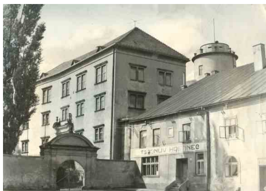
Historii hostince U Tšponů na Horním náměstí ukončila éra znárodnění. Dnes zde místo výčepu a kuželniku najdeme kanceláře a depozitáře muzea.