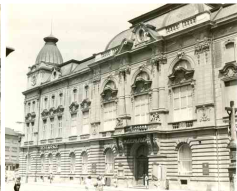
Restaurace v reprezentativním Městském domě slouží Přerovanům již 150 let.