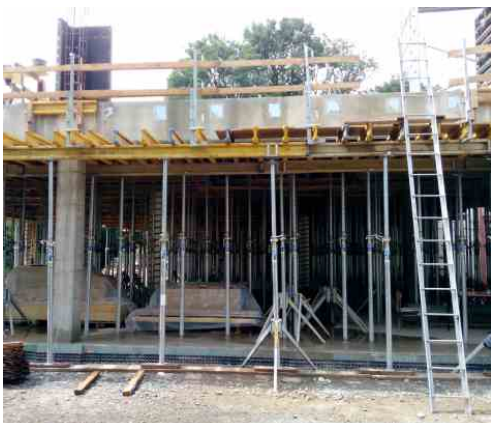
Stojky již podpírají tuny železa a betonu podlah 1. nadzemního patra. Červen 2021.