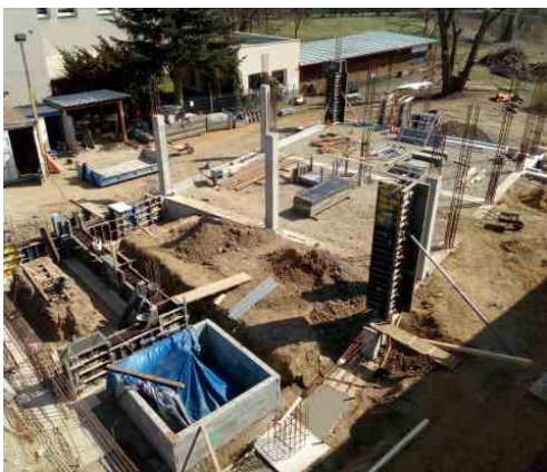
Betonáž výtahové šachty a nosných sloupů. Duben 2021.