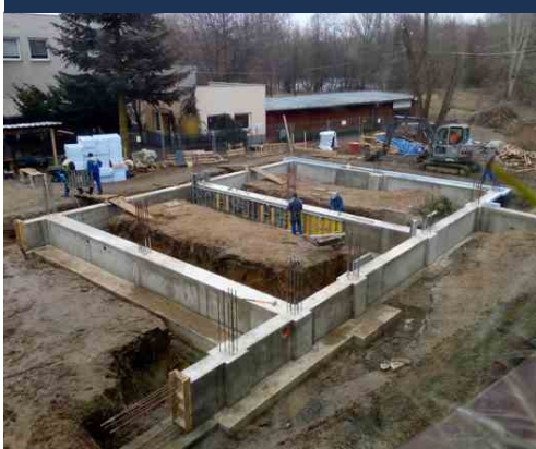
Betonáž nosných zdí. Únor 2021.