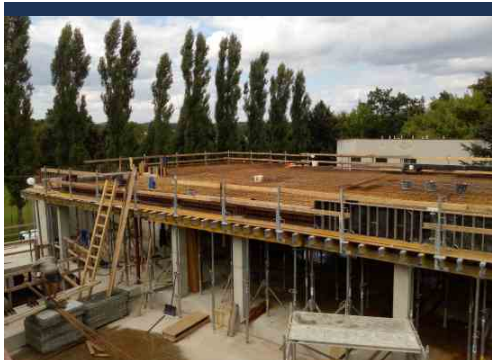
Složitá armatura střešky nové budovy. Srpen 2021.