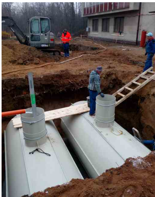
Usazení septikových nádrží. Prosinec 2020.