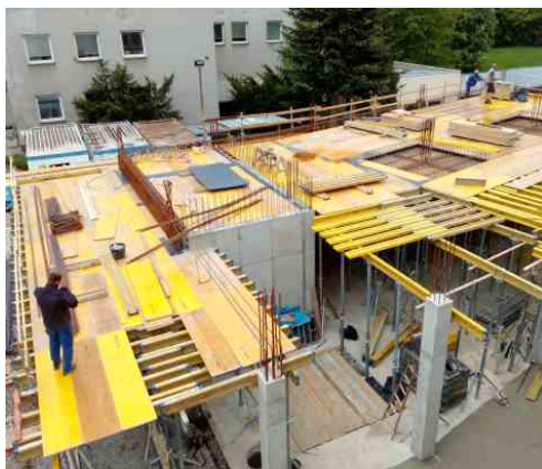
Montáž složité armatury podlah 1. patra. Květen 2021.