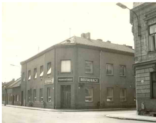
Hostinec U moravské orlice na rohu Sušilovy a Jungmannovy ulice patří mezi nejdéle fungující přerovské hostince.