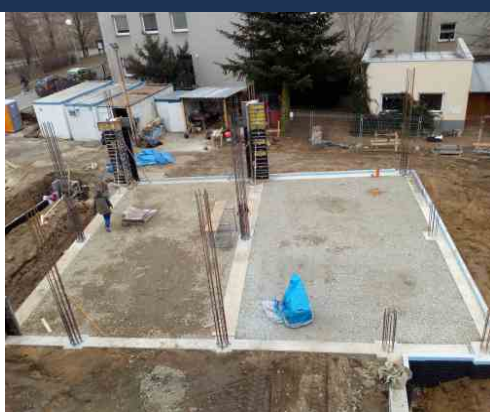
Dokončování základových desek a armatury nosných sloupů. Březen 2021.