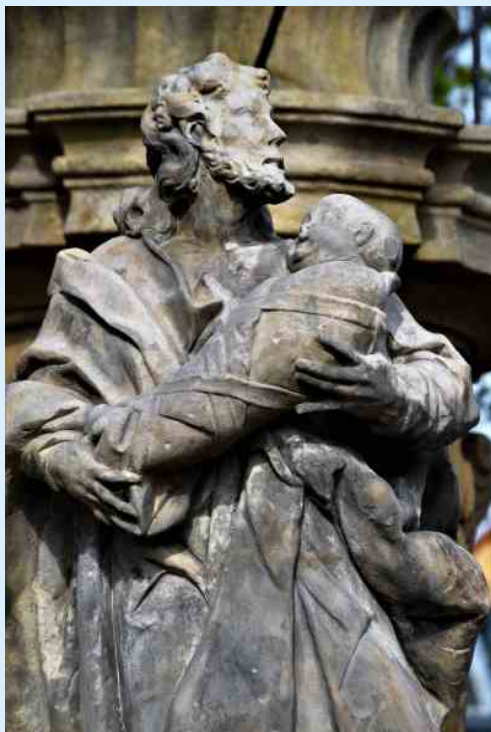
Sv. Josef s Ježíškem - detail ze sloupu sv. Jana Nepomuckého v Dubu nad Moravou

Sv. Josef bývá zpravidla zpodobňován v truhlářské dílně obklopen tesařským náčiním. Dále jako spící muž s andělem Páně, s poutnickou holí, košem, s oslem na cestě do Egypta, s Pannou Marií a novorozeným Ježíšem, případně jej jako batole vedou za ruku. Často bývá zdůrazňována jeho péče o Ježíška (míchá kaši nebo drží lžící), nebo je zachycen při předávání řemesla synovi a společné práci v dílně. Výjimkou není ani scéna zasnoubení s Pannou Marií a nakonec i oplakávání sv. Josefa na smrtel-