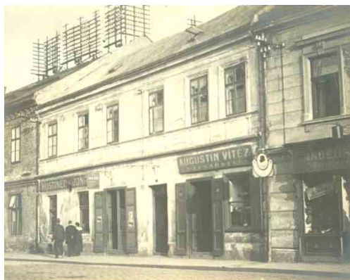
Hostinec U Jonášů (známý jako Nordpol) v Bratrské ulici ustoupil v polovině 20. let budově pošty a spořitelny.