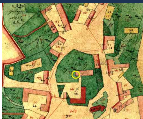
Střed obce Předmostí s kostelem sv. Máří Magdaleny a farou vyobrazený na výřezu stabilního katastru v roce 1830. Západní nároží stavby odkryté výzkumem v roce 2021 severně od objektu fary vyznačeno žlutým kroužkem.

Na základě studia historických mapových podkladů lze odkryté základy ztotožnit s objektem obdélného půdorysu, který je zakreslen na císařských povinných otiscích map stabilního katastru z roku 1830 severně od budovy fary. Během postupného snižování terénních vyrovnávek v interiéru objektu bylo nalezeno velké množství zlomků novověké kuchyňské keramiky z 18. a 19. století.