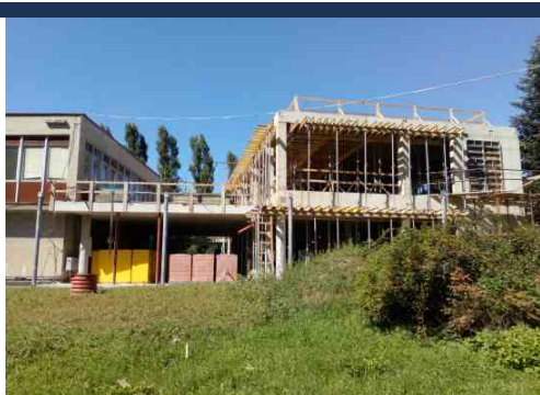
Pomalu se již rýsuje celkový tvar nové budovy. Září 2021.