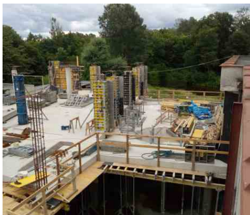
Napojování 1. patra na stávající budovu ORNIS. Červenec 2021.