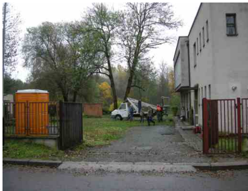
Stromy ještě stojí, hlavní vchod ještě funguje ... Říjen 2020.