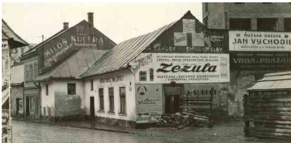
Hostinec Na Špici na začátku Velké Dlážky, který v roce 1935 musel ustoupit stavbě nové sokolovny (na snímku vpravo).