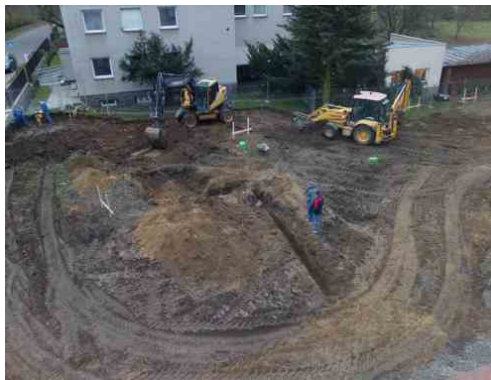
První stavební rýha. Listopad 2020.