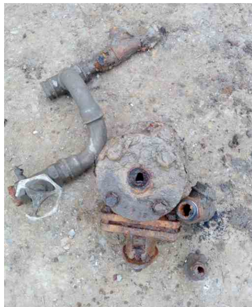
Nejvyšší čas na generální přestavbu budovy ORNIS - stav vodovodních trubek. Leden 2021.