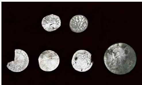
Farní zahrada. Mince nalezené během výzkumu.

Vedle keramiky bylo členy archeologického týmu za pomoci detektorů kovů postupně objeveno 6 ztrátových mincí, z nichž nejstarší je stříbrný parvus z doby panování českého krále Jana Lucemburského (1310–1346). Na líci ražby je vyobrazen Český lev, na rubu je patrně poprsí a hlava svatého Václava.