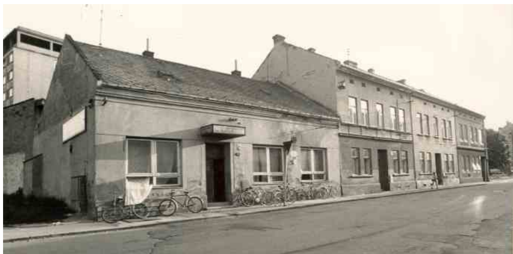
Hostinec Pod valy (před znárodněním U Gremliců) v Kozlovské ulici patřil mezi letité přerovské podniky. V 80. letech byl i s celou ulicí asanován z důvodu panelové výstavby.