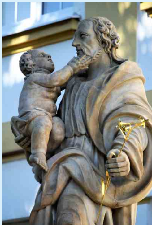
Sv. Josef s Ježíškem před školou v Kralicích na Hané