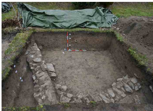
Kamenné základy stavby odkryté v sondě 3 lze ztotožnit s objektem vyobrazeným na stabilním katastru v roce 1830.

V jedné ze sond bylo zachyceno západní nároží stavby, jejíž kamenné základy tvoří bloky lokálního devonského vápence kladené na hlínu.