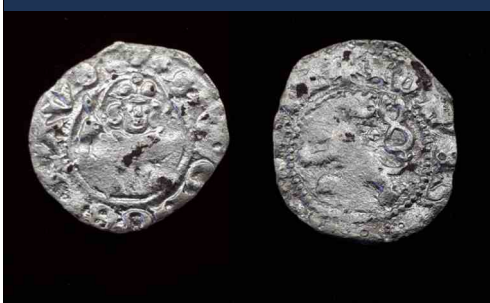
Stříbrný parvus českého krále Jana Lucemburského o rozměrech 12x14 mm nalezený během výzkumu

bovním znamením v podobě osmicípé hvězdy a špatně čitelným opisem, která byla původně umístěna na láhvi vína. Výsledky první etapy archeologického výzkumu naznačily velký potenciál tohoto, moderní výstavbou dosud nedotčeného prostoru v rámci Předmostí.