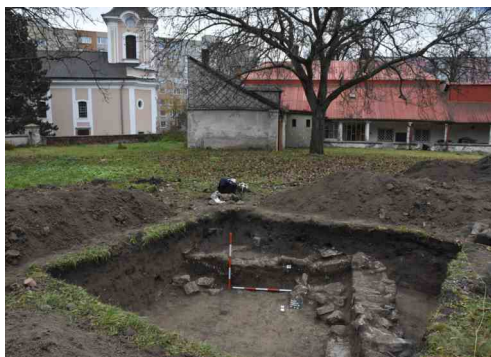
Předmostí. Celkový pohled sondy S3 v roce 2021. V pozadí kostel sv. Máří Magdaleny a objekt staré fary.

Současná plocha výzkumu se nachází v severovýchodní části farní zahrady, která nebyla doposud podrobena archeologickému výzkumu. Přitom se nacházíme v samotném centru legendární archeologické lokality Předmostí. Nejstarší písemná zmínka o Předmostí pochází z roku 1362, kdy je zmiňován farní kostel a farář kněz Macůrek. V letošním roce uplyne právě od této zmínky 660 let.