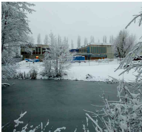
Prosinec 2021 - většina prací již probíhá uvnitř nové budovy.