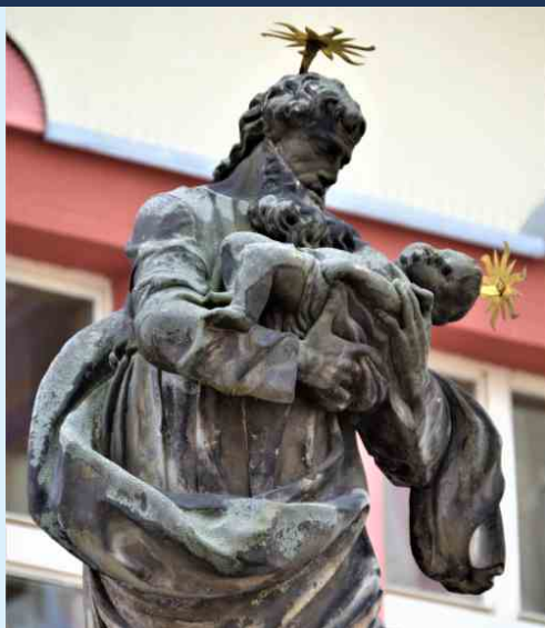
Sv. Josef před kostelem sv. Vavřince v Přerově