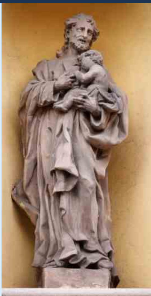
Sv. Josef s Ježíškem v nice fasády kláštera františkánů v Moravské Třebové

Moravské Třebové, Novém Bydžově, Sedlčanech, Šumperku, Toužimi či Vysokém Mýtě. Menší sošky zdobí také niku na průčelí kostela sv. Andělů strážných v Kyselovicích u Chropyně, stěnu kostela v Křelově či hřbitovní zeď v Záhlinicích. Jeden z nejstarších raně barokních votivních sloupů se sochou sv. Josefa s Ježíškem spatříte v Brtnici (1661).