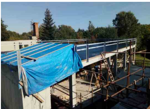
Stavba pokračuje přípravou střešní plochy. Říjen 2021.