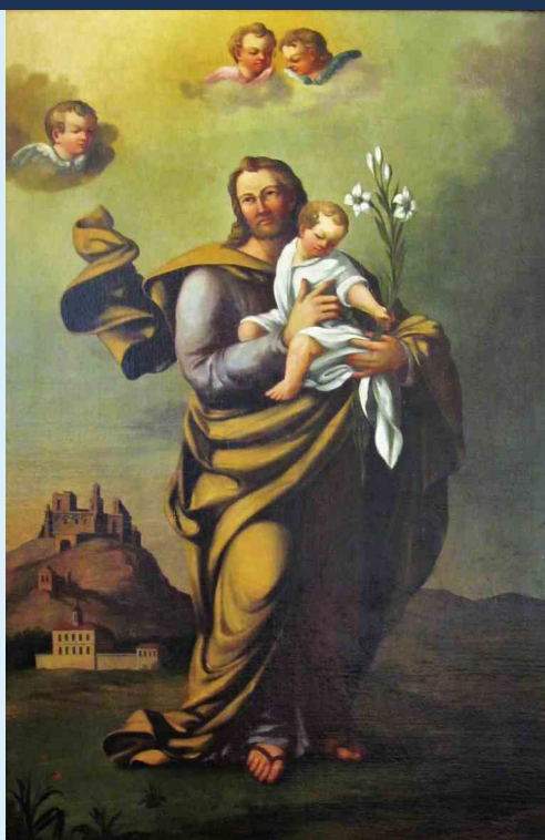
Svatý Josef na olejomalbě v interiéru zámku Žampach