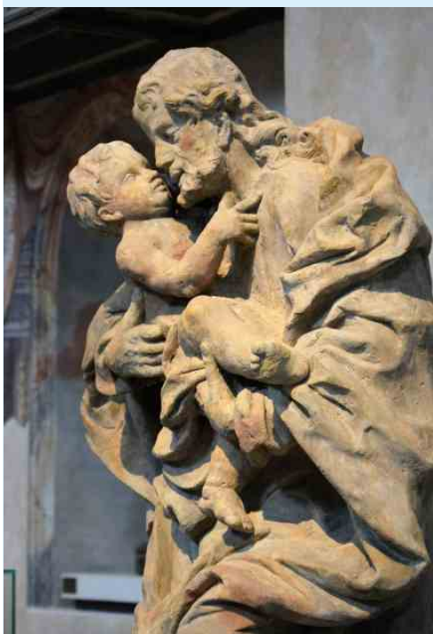
Sv. Josef s Ježíškem v Muzeu barokních soch v Chrudimi

ném loži. Mezi základní atributy patří pracovní nářadí (hoblík, pila, nebozez, sekera, úhelník), poutnická či rozkvetlá hůl (podle apokryfního příběhu v Jakubově Protoevangeliu byl takto zvolen za Mariina muže) a zřejmě nejčastěji bývá využito reprezentačního figurálního zobrazení - důstojný, většinou stojící muž s malým Ježíškem v náručí a lilii jako symbolem čistoty (bílá lilie je rovněž atributem ochrany před onemocněním tuberkulózou (dříve souchotiny či úbytě) a v tomto významu ji do svého znaku zvolil i papež František.