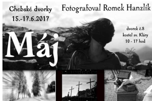
Pozvánka na chebskou premiéru výstavy „Máj“

produkcí audiovizuálních děl. Z jeho posledních aktivit je třeba zmínit také produkci alba Sbohem a řetěz - desku coverů Filipa Topola a Psích vojáků, navíc v roce 2015 šel do kin jeho dokument Takovej barevnej vocas letící komety, pojednávající o této kapele. Je jedním ze zakládajících členů kapely Už jsme doma, se kterou si příležitostně zahraje. Rád fotí (je držitelem dvou cen Czech Press Photo) a cestuje. Už dva roky také mapuje svůj každodenní život na facebookovém fotoblogu Paperback Life.