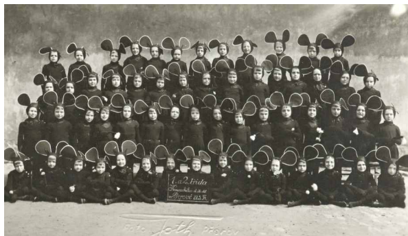
Roztomilým myškám z Komenského chlapecké školy můžeme jejich společnou fotografii k ukončení školního roku jen závidět.