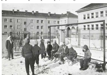
Sněhová nadílka - radost dětí v každé době!