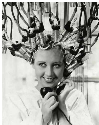
Dnes již díky moderním technologiím nemusíme pro půvab hrůzd stříbrného plátina usedat pod zářičem připomínající svým vzhledem středověké mučnické nástroje. Jedno je však potřeba stále - šikovné ruce kadeřníka!

Objednat se lze telefonicky na čísle 603 545 052, nebo osobně v salónu (areál Střední školy zemědělské, Osmek 368/49, Přerov).