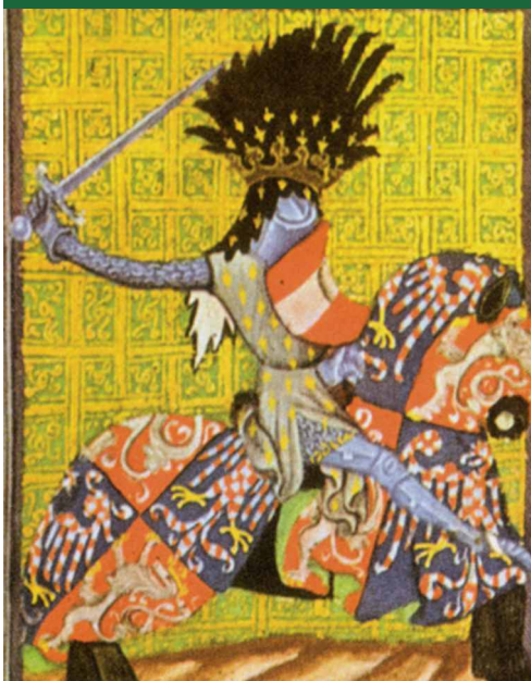
Přemysl Otakar II. - vyobrazení v kodexu Jana z Gelnhausenu (přelom 14. a 15. století)

V této době totiž přestaly být meče výhradním majetkem vyšších sociálních vrstev a staly se součástí výzbroje měšťanů i vesnických obyvatel. O tomto stavu nás informuje celá řada písemných pramenů, především pak různé policejní řády, které omezují nošení zbraní v areálech měst. Omezení jejich nošení se týkalo rovněž interiéru veřejných úřadu a budov, z pochopitelných důvodů především krčem. Tyto zprávy máme sice většinou až z průběhu 16. století, ale o tom, že daná praxe mohla fungovat již v předhusitských Čechách, svědčí třeba velký počet zastavených zbraní při půjčkách pražských měšťanů. Nepřímo pro to svědčí i fakt, že na rozdíl od dřevcových či palných zbraní a součástí zbrojí se s chladnými pobočními zbraněmi, tedy meči, tesáky, dýkami a v pozdějším období především kordy, setkáváme téměř výhradně v soukromých zbrojnicích jednotlivých měšťanů.