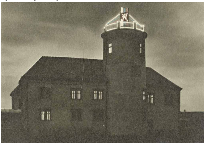
Takto přispěly Městské elektrické podniky k oslavám desátého výročí vzniku ČSR.