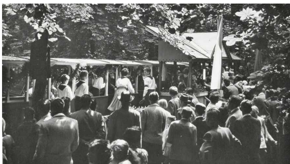
Pionýři zahajují 14. srpna 1960 provoz „svě“ železnice v parku Michalov. Po této oblíbené atrakci dodnes teskní srdce nejedného Přerovana.