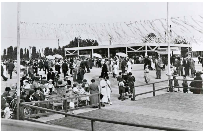
Přerované na Středomoravské výstavě v roce 1936.

Aby jubilejní výstava nezapadla mezi obrovské množství prezentací nejrůznějších forem, které ve výroční rok zaplaví sdělovací prostředky, klademe si za cíl vyprávět příběh 100leté republiky očima našeho města a jeho okolí. Věříme, že prostřednictvím poutavého výtvarného řešení přiblížíme život našich předků nejen z pohledu událostí „velké politiky“, ale zejména důrazem na představení běžných osudů místních občanů a jejich „obyčejných“ starostí všedního života. Jednoduše řešeno chceme ukázat, jak se dramatické události dějin Československé republiky