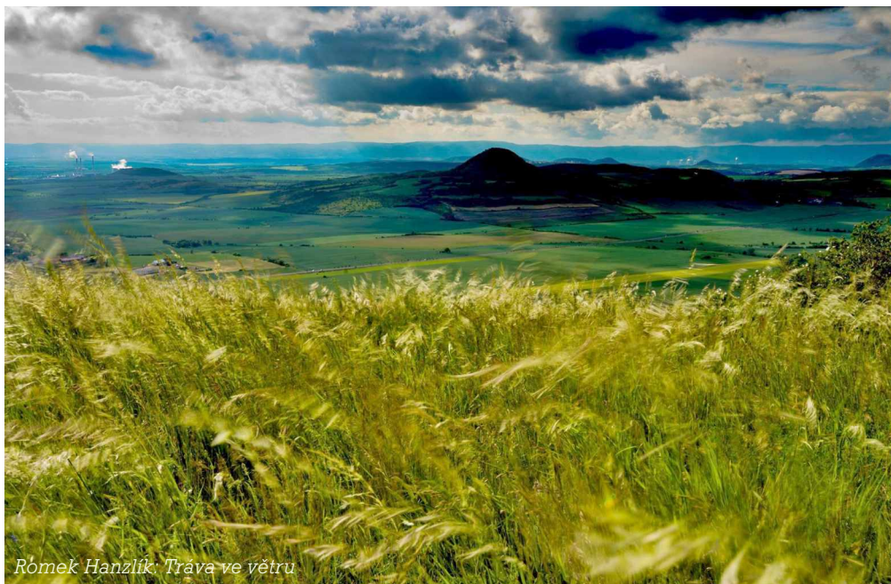
Romek Hanzlík: Tráva ve větru