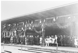
Přivítání TGM na přerovském nádraží v roce 1921.

Při příležitosti nedožitých 168. narozenin prvního československého prezidenta Tomáše Garrigue Masaryka získá ve středu 7. března 2018 každý návštěvník výstavy „100letá republika. Příběh jednoho města (1918– 1948)“ ke vstupnému malý dárek. A proto neváhejte s návštěvou naší výstavy právě v tento den.