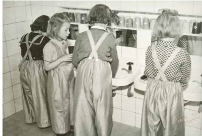
Pozná se některá z čtenářek na této fotografii, jež jako by vypadla ze sloganu Čistota - půl zdraví?

Nejen tyto, ale desítky dalších fotografií si budete mít možnost prohlédnout v obou výstavách 100letá Republika. Příběh jednoho města ve výstavních prostorách Muzea Komenského v Přerově.