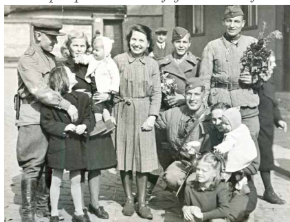
Šťastné mámy se sovětskými vojáky v prvních dnech svobody. Jejich radost přechází i na malé děti, ačkoli její důvod plně pochopí, až vyrostou.