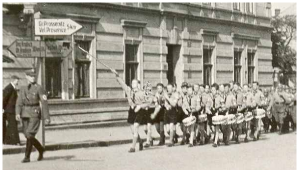
Naproti tomu tyto „myšky“ jsou vše ostatní, jen ne roztomilé. Upovědomovali si však plně přerovští Hitlerjugend k čemu jsou zneužívání?