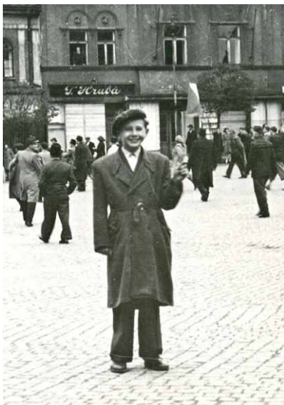
Co se asi honí hlavou veselému chlapci s československou vlajčkou v den Přerovského povstání? Odpověď na otázku nebude až tak složitá.